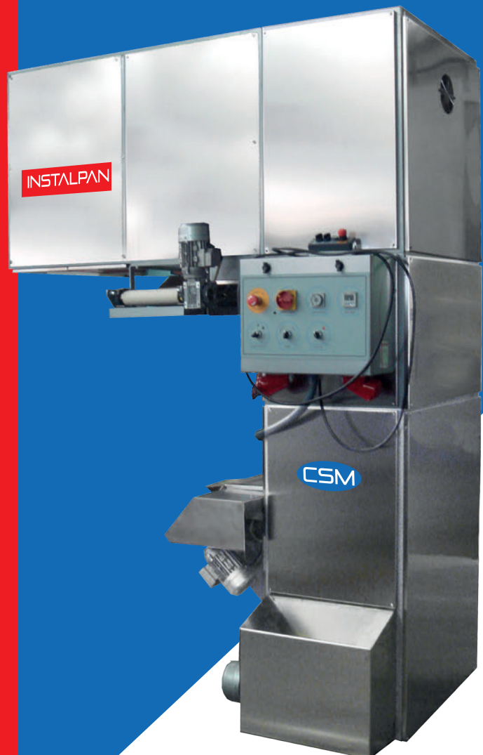
/// CÁMARA EN L L PROOFER L BALANCELLE