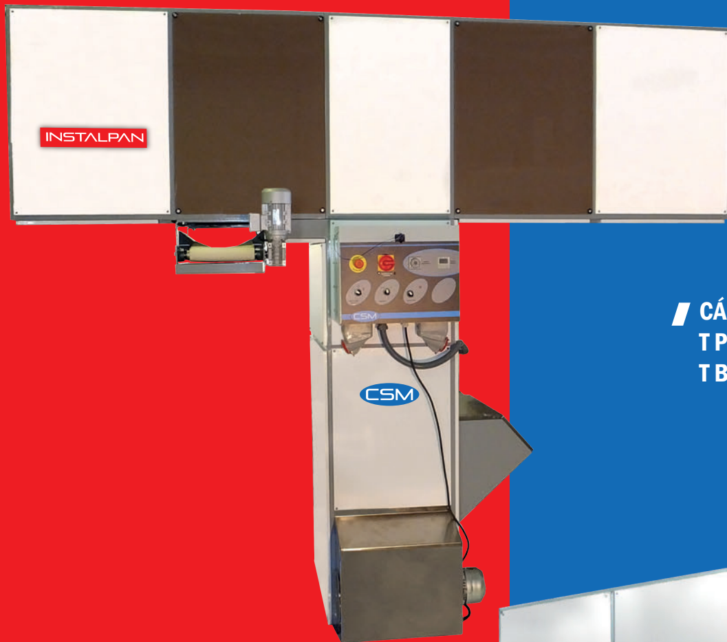
/// CÁMARA EN T T PROOFER T BALANCELLE